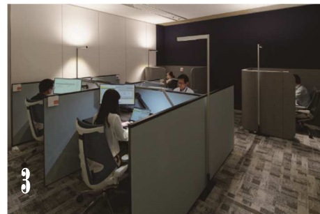
3 NEW NORMAL