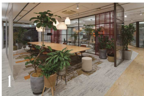
1 ABW Activity Based Working