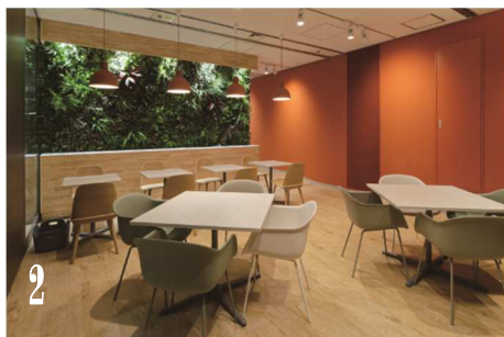
2 WELL WORKPLACE